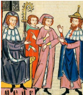
Een 14e eeuwse beschrijving van een beroemde Jood genaamd Süsskind van Trimberg, van de Manesse codex

Het was dan ook pas in de middeleeuwen dat de joodse kleding steeds gevarieerder werd. Een deel hiervan was te wijten aan de decreten van de verschillende soorten buitenlandse heersers. Bepaalde koningen dwongen joden alleen maar zwart te dragen, anderen hadden speciale sjerpen nodig om hen als joden te identificeren, en in een groot deel van het middeleeuwse Europa moesten de joden opvallende, funky hoeden dragen (inclusief de puntige gele).