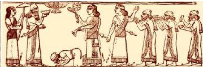
Left: A small section from the Black Obelisk depicting Israelites greeting King Shalmaneser III. Above: a reproduction of the Black Obelisk image depicting the Israelite delegation (on the right).

Het was dan ook pas in de middeleeuwen dat de joodse kleding steeds gevarieerder werd. Een deel hiervan was te wijten aan de decreten van de verschillende soorten buitenlandse heersers. Bepaalde koningen dwongen joden alleen maar zwart te dragen, anderen hadden speciale sjerpen nodig om hen als joden te identificeren, en in een groot deel van het middeleeuwse Europa moesten de joden opvallende, funky hoeden dragen (inclusief de puntige gele).