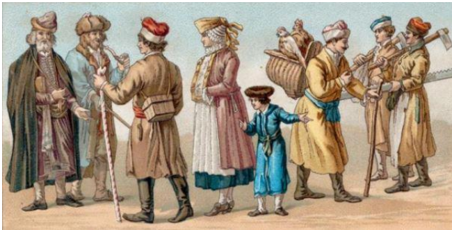
Lithograph uit 1880 die de Joodse kledstijl aangeeft

Cornutus moesten dragen om hen te onderscheiden. Het kan dan ook heel goed zijn dat deze hoofdtoeien aanleiding gaven tot wat we vandaag de dag kennen als een keppeltje. We zien dat joden over het algemeen kleding droegen die leek op die van hun burenen. Zelfs die oude afbeeldingen van Israëlieten vertonen kleding die lijkt op die van andere Semitische en Kanaänitische groepen. Toen het Russische rijk in de 19e eeuw verordende dat Joden hun kleding moesten opgeven en Russische kleding moesten aannemen, protesteerde de Kotzker Rebbe (rabbi Menachem Mendel van Kotzk) niet omdat hij betoogde dat er niet zoiets bestaat als een aparte “Joodse kleding” in ieder geval. Joden droegen namelijk altijd kleding zoals iedereen, en de Joodse kledij varieerde dan ook best wel sterk per geografische locatie. De kleding waar de Russen het over hadden was eenvoudigweg de kleding van de Poolse adel uit de 16e en 17e eeuw, die vervolgens door de Joden werd overgenomen.