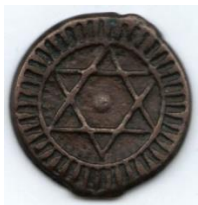
"Zegel van Salomo" op een 19e-eeuwse Marokkaanse munt.

De Talmud zegt niet dat er een hexagram op de ring stond, maar dat er HaShem's Naam erin gegraveerd was. Het zijn dan ook Arabische teksten die als eerste de ring verbinden met het hexagram. Sommigen proberen onderscheid te maken tussen de "Davidster" en het "Zegel van Salomo" door te suggereren dat het hexagram van de eerste bestaat uit overlappende driehoeken terwijl het hexagram van de laatste met elkaar verweven is: Dit argument lijkt ongegrond; de twee symbolen zijn één en dezelfde, waarbij de davidster vaak met elkaar verweven wordt afgebeeld en het zegel van Salomo overlappend wordt afgebeeld (soms in een cirkel).