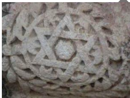
Ster van David in de synagoge van Kafarnaüm

Het hexagram is een relatief eenvoudige vorm en komt voor in allerlei kunst en architectuur in heel Europa en Azië. Er zijn zelfs mensen die andere soorten van hexagrammen als een soort van aanbiddings-symbool erkennen. Hoewel maar heel weinig oude synagogen (let wel oude synagogen) deze ster dragen, doen veel kerken dat wel. De beroemdste synagoge die deze ster (hexagram) heeft, is die is ontdekt in 1866 in Kafarnaüm (Kfar Nachum), een dorp in Galilea dat oorspronkelijk werd gesticht door de Hashmoneërs na hun Chanukah overwinningen. Deze synagoge is eigenlijk populairder onder de christenen, omdat de evangeliën van Lukas en Marcus beschrijven hoe een zekere Jezus daar predikte.